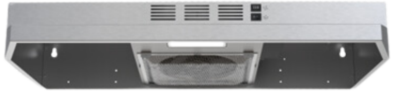
OHF130-SS / OHF124-SS